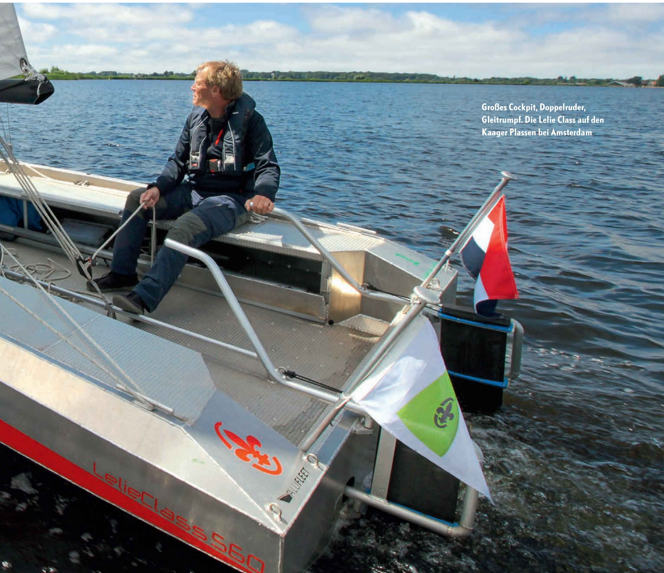
Großes Cockpit, Doppelruder, Gleittrumpf. Die Lelie Class auf den Kaager Plassen bei Amsterdam

aus Polyester. Der ist aber weder so robust noch so schnell unter Segeln.